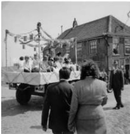
Bevrijdingsdag in 1960