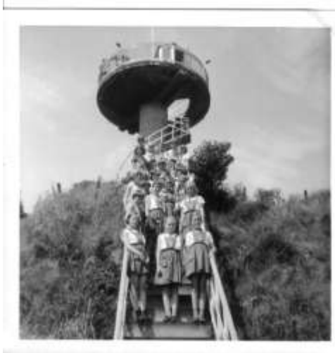
Zomerkamp in 1959